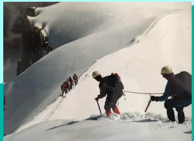
L'ASCENSION DU MONT-BLANC