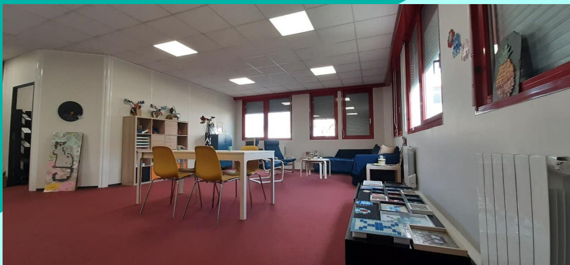
Le local du GEM